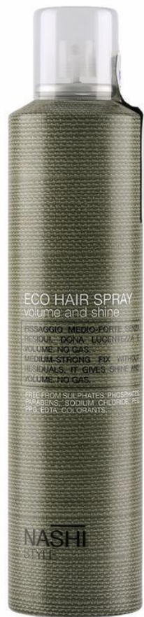
Био лак за обем и блясък, средна фиксация без газ ECO HAIRSPRAY Арт. Номер 0080 – 300 мл – 32 лв