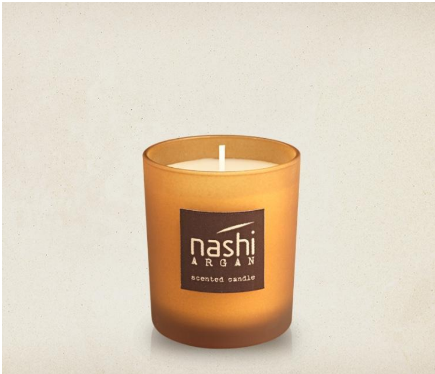
Nashi argan ароматна свещ

Осветете ароматната свещ и пресъздайте атмосферата на Nashi Argan във вашия дом: оставете себе си да бъдете изумени от свежите и оживени нотки