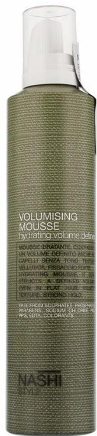
Пяна за обен Арт. Номер 0055 – 300мл-28 лв